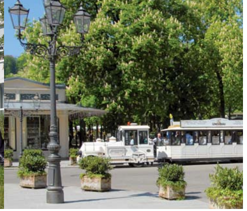
Stadtrundfahrt mit der City Bahn