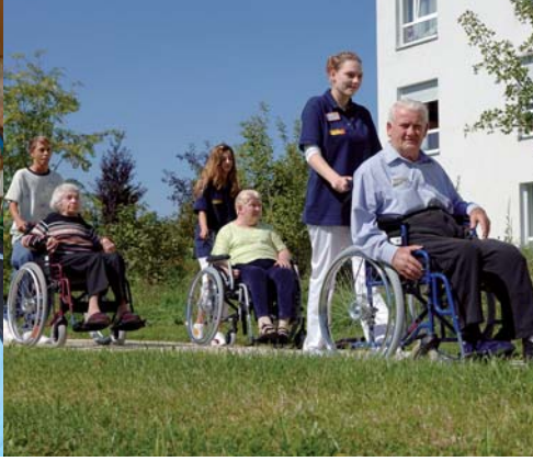
Ein Job mit Zukunft - Altenpfleger beim ASB