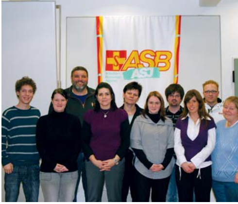
Der neu gewählte Jugendvorstand