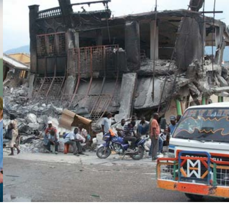
Alltag in Port-au-Prince